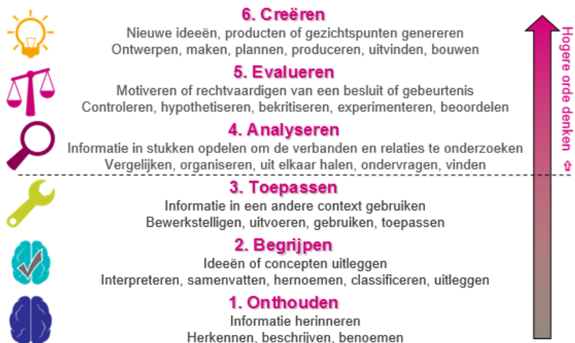
Figuur 2. Taxonomie van Bloom. Overgenomen van www.talentstimuleren.nl .

Als je de taxonomie doorloopt, doe je een beroep op steeds hogere cognitieve vaardigheden (Geert & Van Kralingen, 2012). De taxonomie zou je voor hoogbegaafde kinderen moeten omdraaien als het om boeken gaat: een boek moet uitnodigen om te analyseren, synthetiseren en evalueren (Baskin & Harris, 1980).